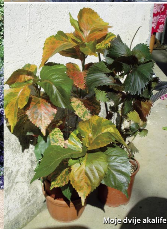
Moje dvije akalife