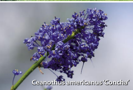
Ceanothus americanus 'Concha'