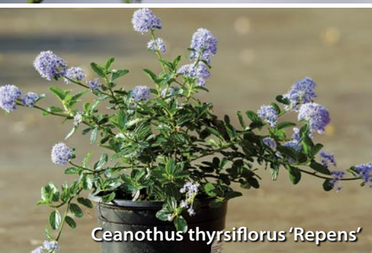
Ceanothus thyrsoiflorus 'Repens'