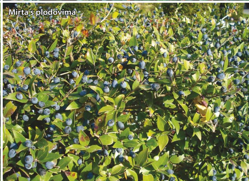
Mirta s plodovima

stalija žuto zelena biljka izrazito glatkih kožnatih listova. Raste u prekrasni grm. Poriječkom je iz Kine i Japana. Ukoliko joj odgovara tlo, može izrasti do 3 m visine, a u loncu je otprilike do 1m. Izuzetno dobro podnosi hladnoću i smrzavicu i zahtijeva obavezno sjenoviti položaj. Jutarnje ili večernje sunce će joj itekako dobro doći, ali ne i podnevno sunce, koje joj doslovno spali lišće, kao i direktni udar bure. Lišće je višegodišnje, vrlo lijepo i sjajno. Biljka je dvodomna, što znači da je svaka biljka ili muška ili ženska. Cvjetovi su vrlo neugledni, sićušni i smečkasti u štitastom cvatu. Ukoliko dođe do oplodnje, ženska biljka stvara bobice koje su veličine zrna kave i kada dozore, dobivaju lijepu crvenu boju što biljci daje izuzetnu ljepotu tijekom cijele zime. Početkom rasta na proljeće, oni otpadaju i ciklus počinje ponovno. Rezanje vršite prije početka vegetacije, ukoliko je potrebno, ili u kasno ljeto ako želite razmnožiti nove biljčice koje ćete najjednostavnije oži-