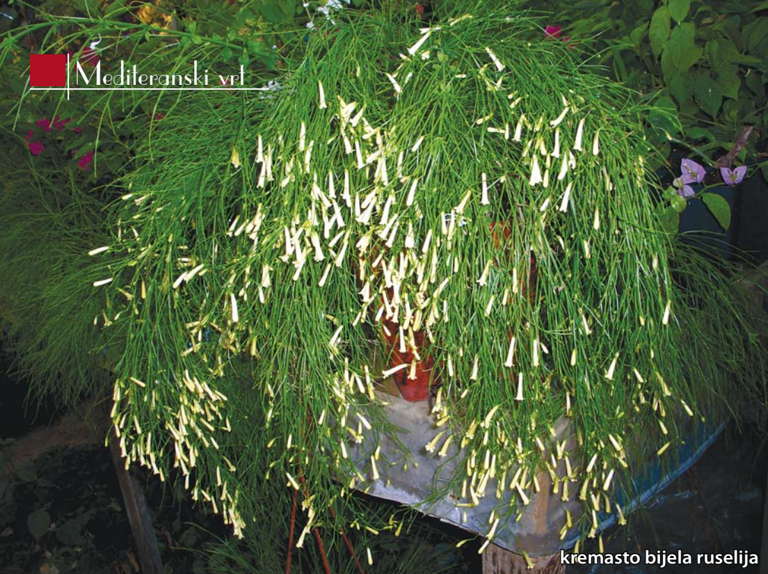
kremasto bijela ruselija