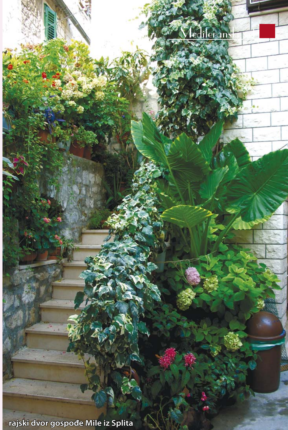
rajski dvor gospođe Mile iz Splita

preparatima za jačanje biljke uz nezabilazno dodavanje željeza radi eliminiranja kloroze (žutila lišća) koje je kod nas vrlo rašireno. Ocvale cvjetove obavezno otkinuti skupa sa zadnja dva lista na grani, da nepotrebno ne crpi snagu biljci.