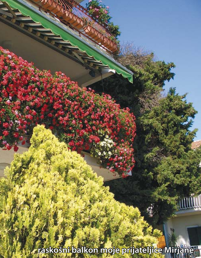
raskošni balkon moje prijateljice Mirjane