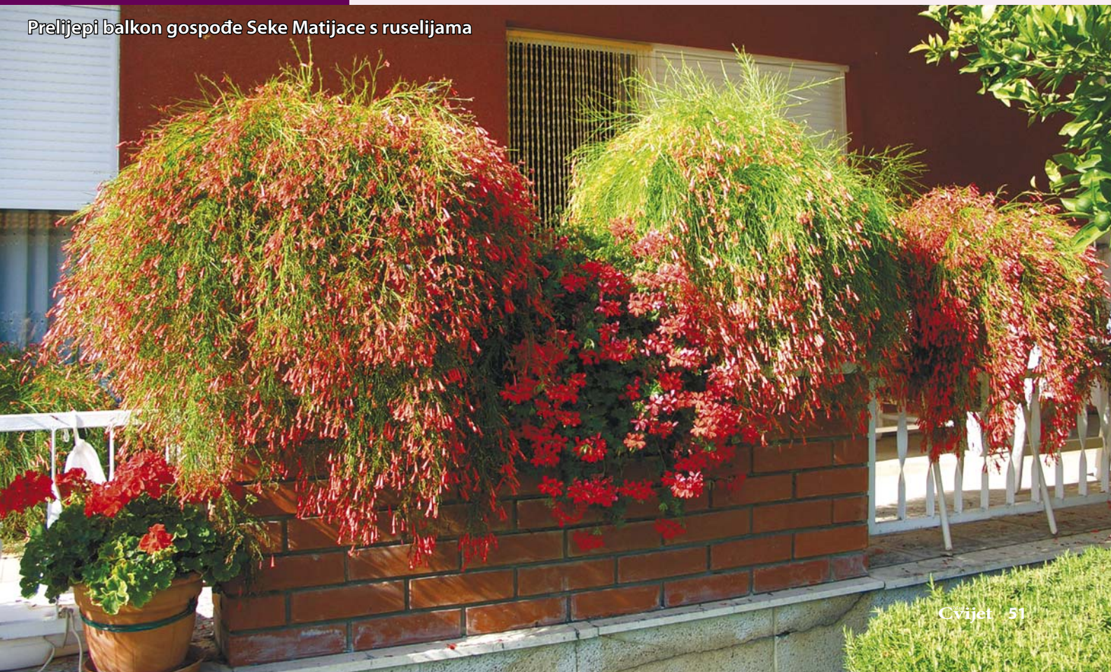
Prelijepi balkon gospođe Seke Matijace s ruselijama

vremena kako ima intezivan rast, počima poprimati izgled žalosne vrbe, što je vrlo efektno za vidjeti. Cvate gotovo cijelu godinu osim ako se nalazi na hladnijem mjestu. Kako raste, biljku postupno presađujete u veći lonac do promjera maksimalno 20 cm za prvu godinu. Sljedeću je godinu možete staviti u veliki lonac, promjera od 50 cm. Obavezno je smjestiti na sunčanu poziciju ili polusjenu. Želite li imati istinski lijepe biljke kao na ovim fotografijama, ruselija mora imati minimalno 3 sata punog sunca. Za ljetnih vrućina kakve smo imali ovo ljeto zalijevanje je svakodnevno, ovisno o veličini biljke i lonca. Prehranjivati obavezno jednom tjedno, gnojivima koja su vam dostupna. U ljetnom periodu gnojivima za pospišivanje cvatnje, znači s većom koncentracijom fosfora i kalija te mikroelemenata.