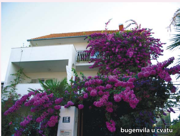
bugenvila u cvatu

Obavezno staviti 2 - 4 cm drenaže od stiropora na dno lonca. Ruselija se razmnožava reznicama grančica kao i većina biljaka. Ukoliko ste joj udovoljili na ovakav način, nagradit će vas neprekidnom cvatnjom tisućama koraljno crvenih i kremasto bijelih cvjetica, trubica, koje su duge oko 2 cm. Kada primijetite da su se pojedine grane iscvale i da više ne cvatu tako intenzivno, odrežite ih i na takav način ćete potaknuti biljku na ponovni rast i cvatnju. Moji najstariji primjerci su stari oko 15 godina, što bi značilo da je dosta dugovječna biljka. Do sada ih nikada nisam ostavljao preko zime vani na otvorenom jer pretpostavljam da temperaturu ispod nule sigurno ne bi preživjele. Za vrijeme mirovanja ili slabijeg rasta može vam se dogoditi da pojedine grančice pocrne i