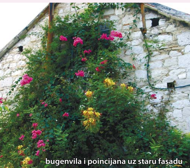
bugenvila i poincijana uz staru fasadu