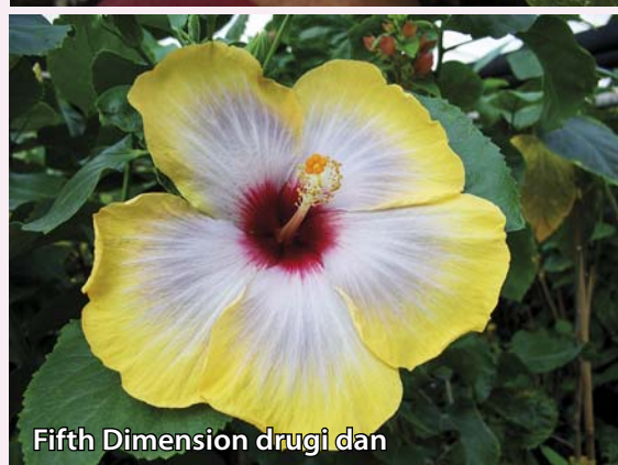
Fifth Dimension drugi dan