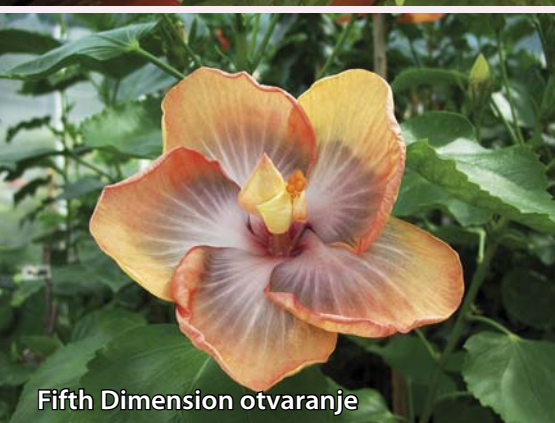
Fifth Dimension otvaranje