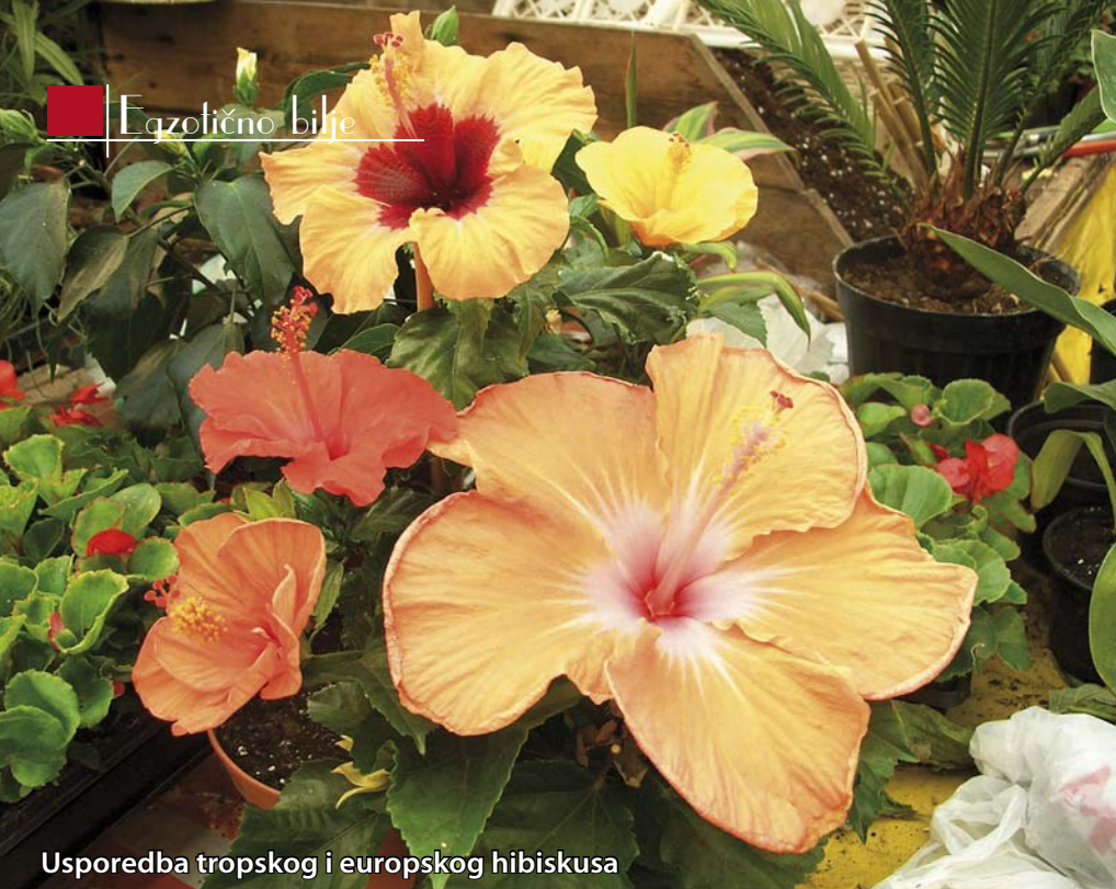
Usporedba tropskog i europskog hibiskusa