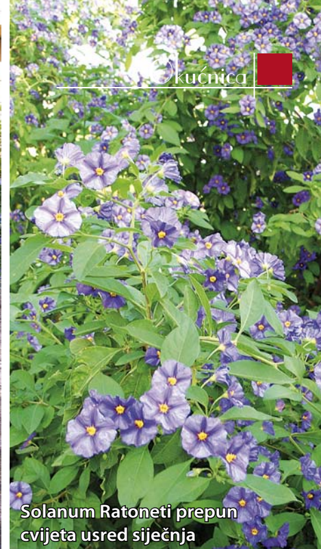
Solanum Ratoneti prepun cvijeta usred siječnja

uvijek nose cvjetove (sjetite se jorgovana), isto vrijedi i za hortenzije. Režite samo male i jadne grančice s tankim i oštrim vrhom. Plumbago i solanum rantoneti ne režite drastično ukoliko želite ranu cvatnju, jer s ovakvom zimom nije došlo do prekida vegetacije pa su svi vrhovi grančica prepuni pupoljaka koji osiguravaju vrlo ranu cvatnju. Preporučio bih vam malo jaču prehranu na bazi mineralnih gnojiva i mikroelemenata, jer te naše biljke nisu imale period mirovanja, a neprestana cvatnja biljku iscrpljuje.