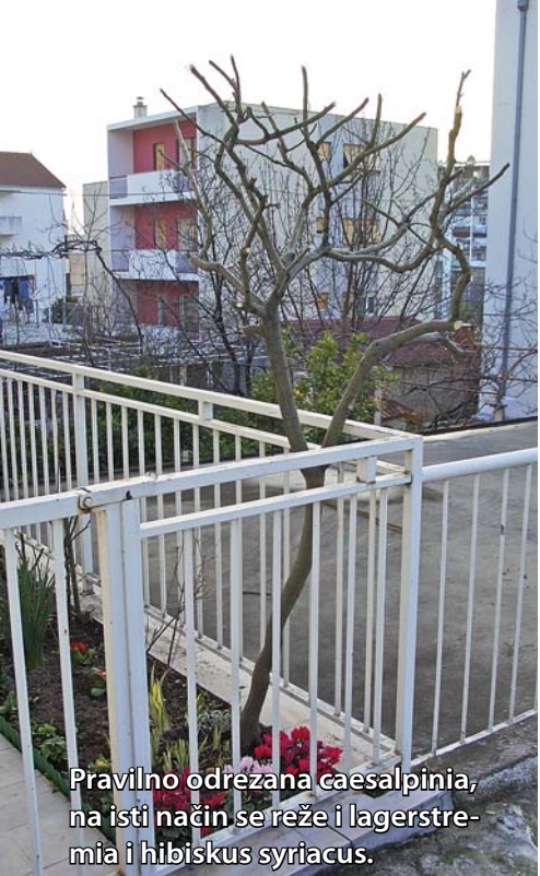
Pravilno odrezana caesalpinia, na isti način se reže i lagerstremia i hibiskus syriacus.