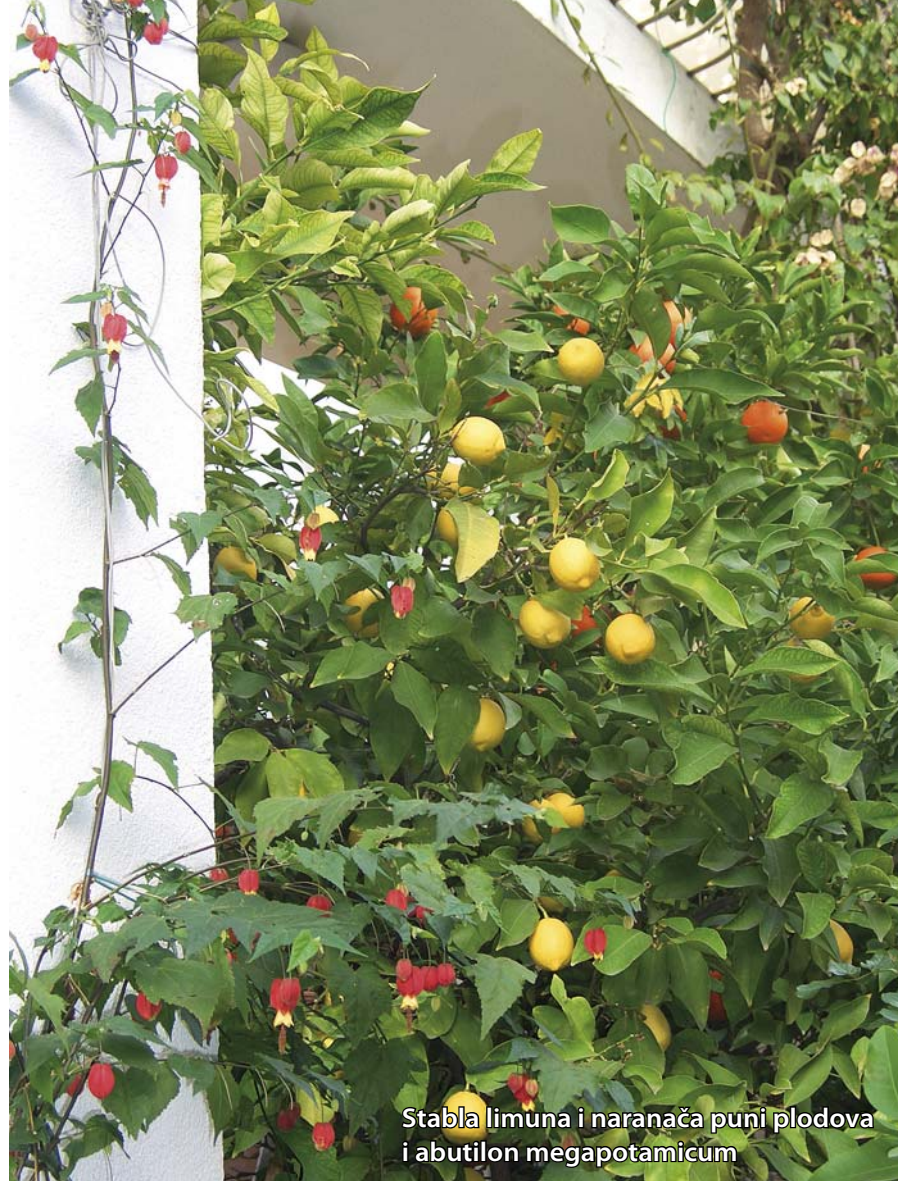
Stabla limuna i naranča puni plodova i abutilon megapotamicum