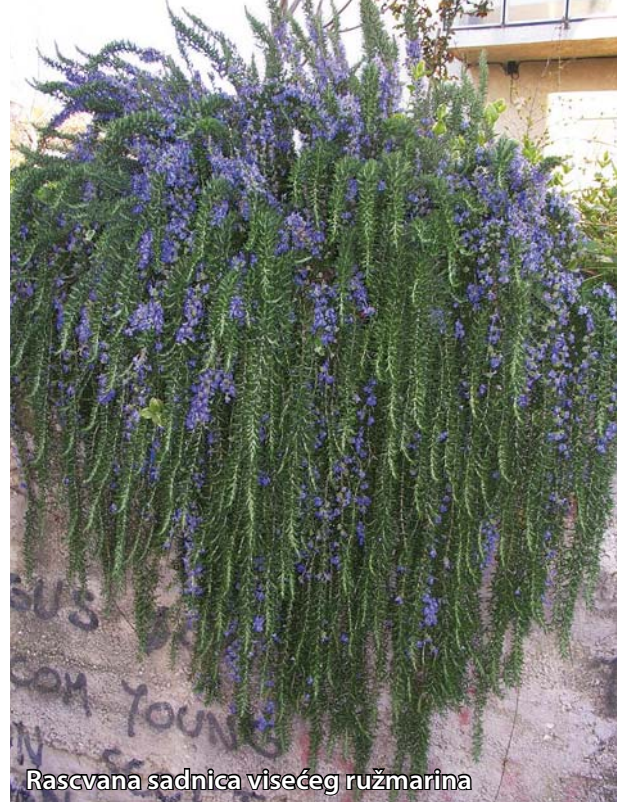
Rascvana sadnica visećeg ružmarina