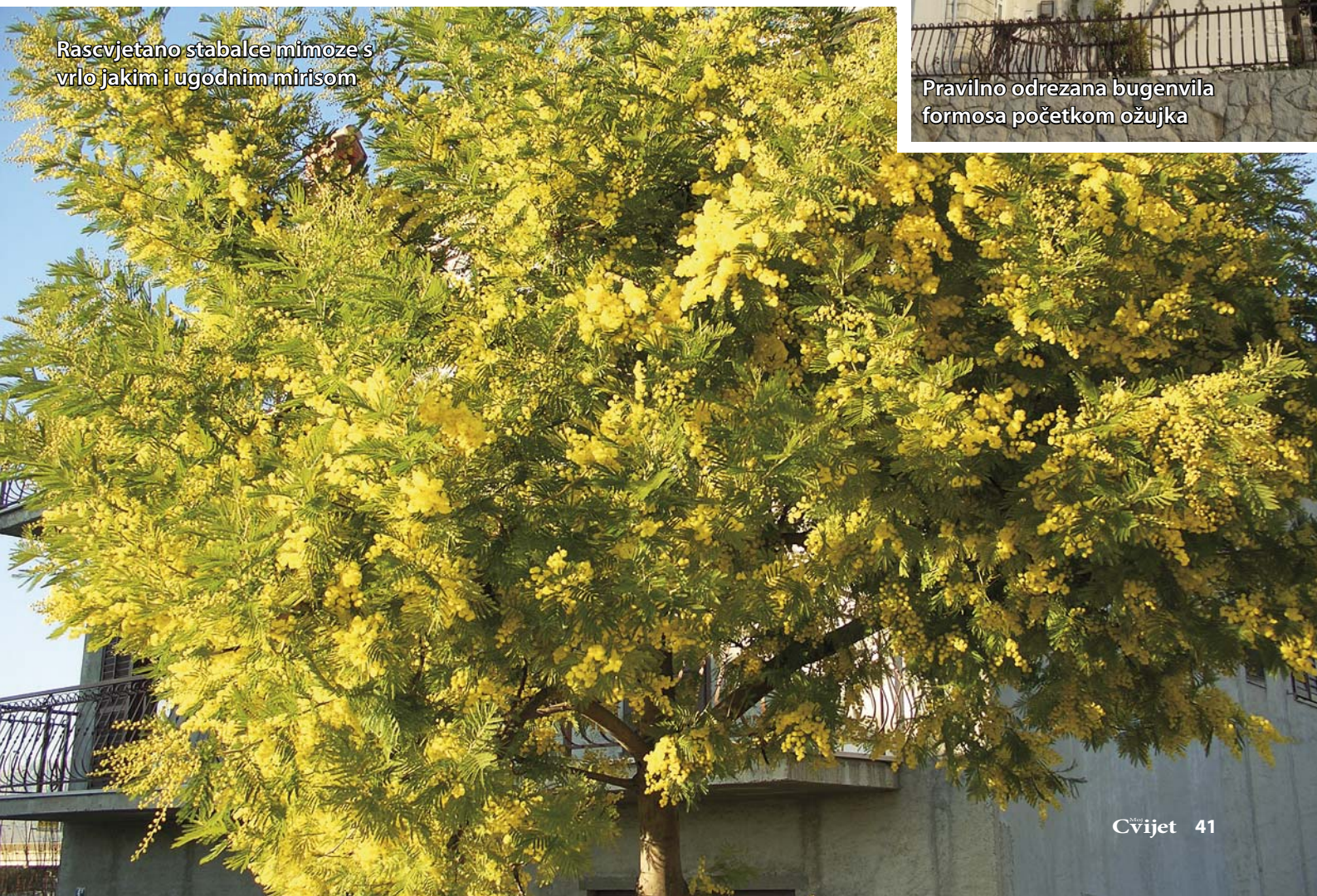
Rascvjetano stabalce mimoze s vrlo jakim i ugodnim mirisom