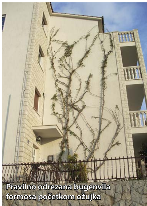
Pravilno odrezana bugenvila formosa početkom ožujka